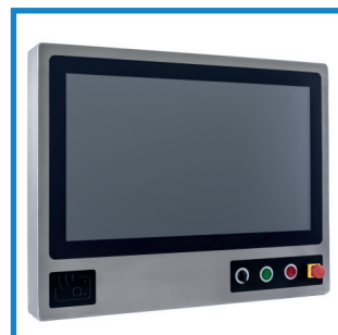
Rundum IP 65 All around IP 65