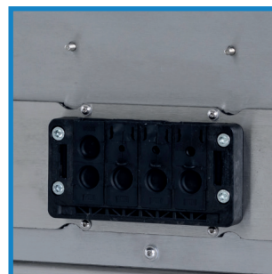
Variable Kabeldurchführung Variable cable gland