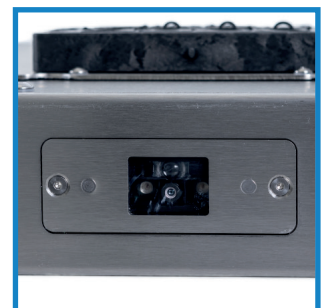
Optionaler Barcodescanner Optional barcode scanner