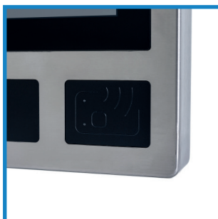
Integrierter RFID-Reader Integrated RFID-reader