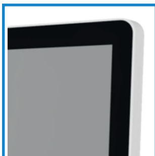
Flächenbündige Front Flush Front