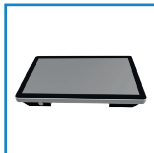
IP 65 frontseitig IP 65 front side