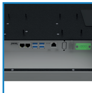
Vielfältige Schnittstellen Various interfaces