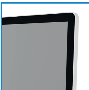
Flächenbündige Front Flush front