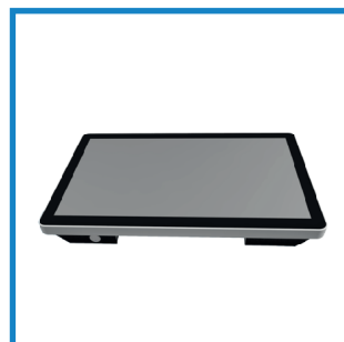
IP 65 frontseitig IP 65 front side