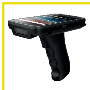
Optionaler Pistolengriff Optional pistol grip