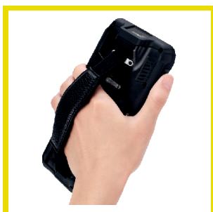
Komfortable Handschleufe Comfortable hand strap