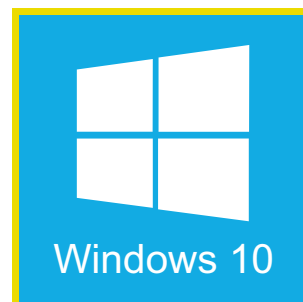
Unterstützt Windows 10 Supports Windows 10