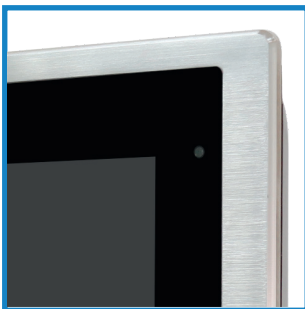
Flächenbündige V2A-Front Flush V2A-front