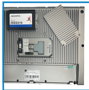
Festplatten-Wechselschacht Hard disk quick-change frame