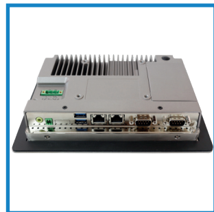
Vielfältige Schnittstellen Various interfaces