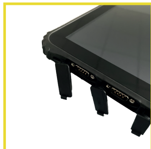
Vielfältige Schnittstellen Rich I/O options