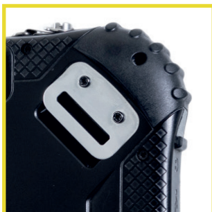
Stoßgeschütztes Gehäuse Shockproof housing