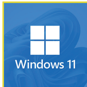
Unterstützt Windows 11 Supports Windows 11