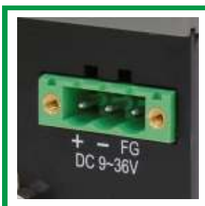
9 ~ 36V DC Spannungseingang 9 ~ 36V DC voltage input