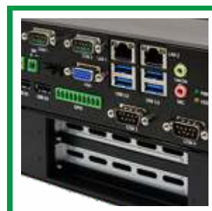
Vielfältige Schnittstellen Various interfaces