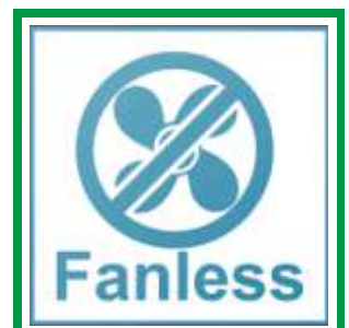
Lüfterloses Design Fanless design