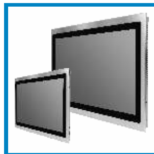
Displaygrößen 15" bis 21.5" Display sizes 15" to 21.5"