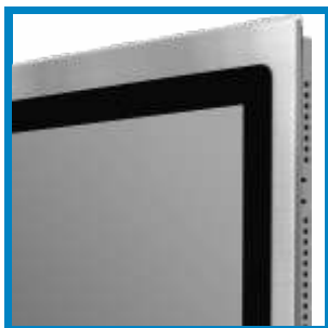
Flächenbündige V2A-Front Flush V2A-front