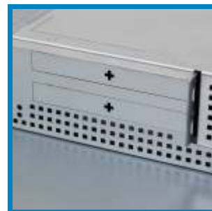
PCI und PCIe Erweiterungsslots PCI and PCIe expansion slots