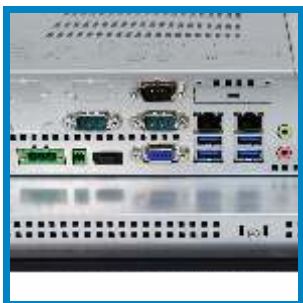
Vielfältige Schnittstellen Various interfaces