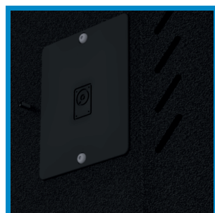
Festplatten-Wechselschacht Hard disk quick-change frame