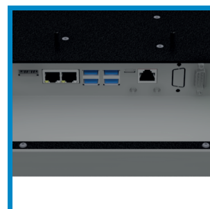
Vielfältige Schnittstellen Various interfaces